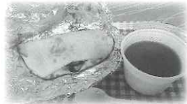
▲ネパールカレー弁当