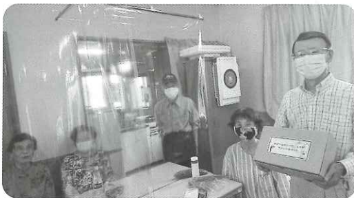
木曜サロン（宮後上区）