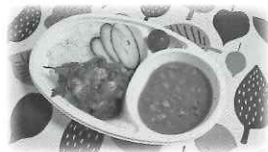
▲フェイジョン弁当 (ブラジルの豆料理)