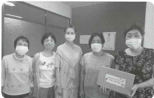
ほのぼのサロン（古知野地区）