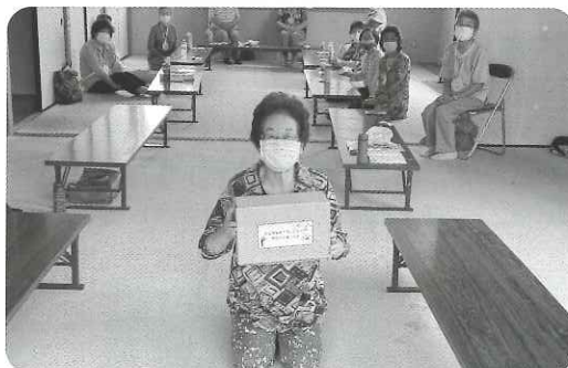
3R宮田サロン（宮田地区）