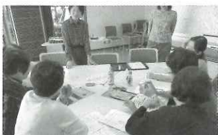
▲日常にある点字って？ 簡単な読み書き講座

この活動以外にも、ボランティアセンターでは様々な活動を実施しています。ボランティアに興味を持たれた方は、お気軽にご相談ください。(☎55-5262)