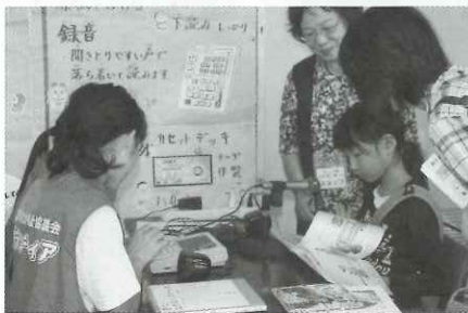
▲音訳の録音体験のボランティア活動