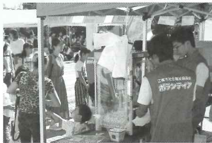
▲ポップコーン販売を行うボランティア活動