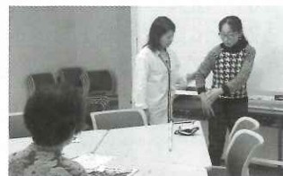
▲声で伝えるガイド方法？ 暗闇の中の光体験講座