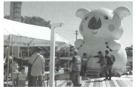
▲来場者の列整備や運営を行うボランティア活動