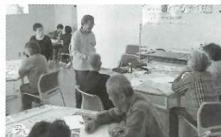
▲遊字って知ってる？ 文字で気持ちを伝える講座