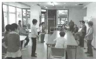
▲リハビリ？脳トレ？ 誰もが楽しめるレク講座

10月21日(月)～10月26日(土)の6日間ボランティアを「知る・学ぶ・楽しむ」をテーマに「第2回ボランティア・マルシェ」を開催しました。参加者・協力者延べ60名、それぞれボランティアグループが企画した内容と交流会が実施されました。