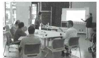
▲みんなでやりましたよ。 手話って楽しいよ講座