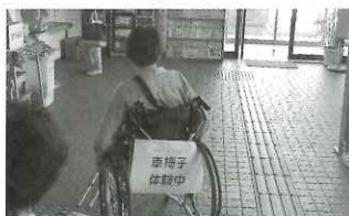
▲いまだに聞けない、 大人の車いす講座