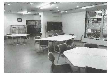
台形のテーブル8脚、イス20脚完備