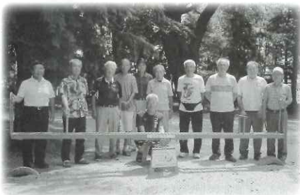
▲安良区の補修されたシーソーと安良区の方々

安良区のシーソーが老朽化により鉄骨部分が破断し、「使用禁止」となっていましたが、補助制度を利用して補修されました。