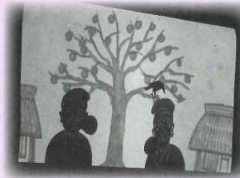
▲わらしべの影絵公演の様子