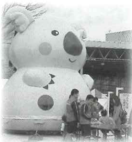
▲大人気!! ふわふわドーム今年も開催!