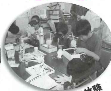
ボランティア体験