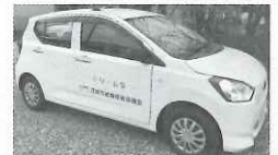
福祉巡回軽自動車 「ドリーム号」