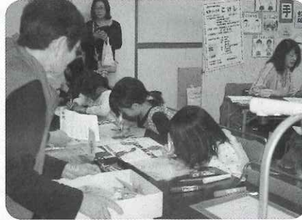
▲ボランティア活動紹介コーナー（要約筆記体験）