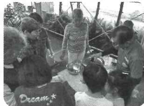
▲ビニール袋1枚で料理！？ 災害時、役立つクッキング講座