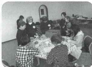
▲子どもも大人も楽しめる、 人形おもちゃづくり講座