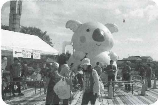
▲子どもの遊び場コーナー（ふわふわドーム）