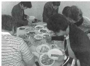
▲地元のお花を使った、 押し花小物づくり講座