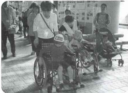
▲福祉体験コーナー（車いす体験）