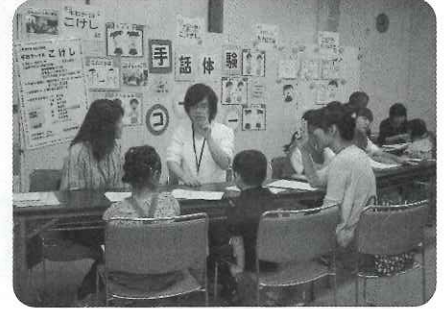
▲ボランティア活動紹介コーナー（手話体験）