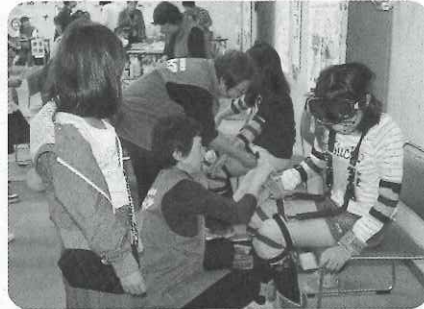
▲ボランティア活動紹介コーナー（高齢者疑似体験）