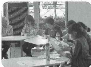
▲声は変えられる！？ 聞き取りやすい美声講座