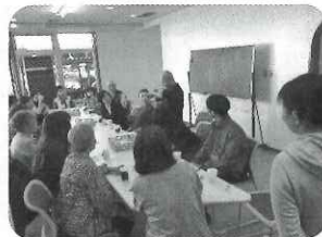
▲今から始める、 はじめての手話講座