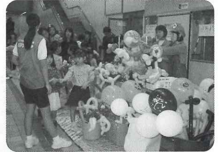
▲バルーンアートプレゼント