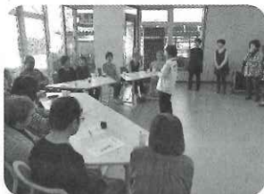
▲あなたの身体年齢は！？ 高齢者疑似体験講座