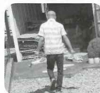
▲参加者が古紙回収