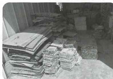
▲古紙を業者に換金し自主財源の確保