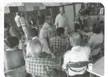
▲内容は毎回変わります (写真は銭太鼓)

※詳しいお問合せなどは、江南市社会福祉協議会までお問合せください (55-5262)