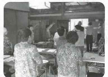
▲みんなでラジオ体操