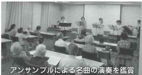
アンサンブルによる名曲の演奏を鑑賞

開催場所:ケアハウスふじの郷 開催日:第4火曜日 時間:午後1時30分~3時30分