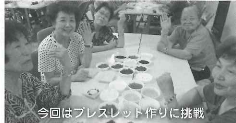
今回はプレスレット作りに挑戦