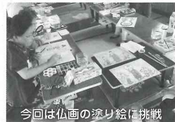
今回は仏画の塗り絵に挑戦