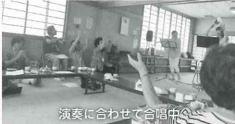
演奏に合わせて合唱中